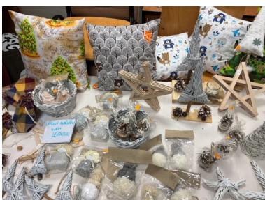
Denní stacionář Domino