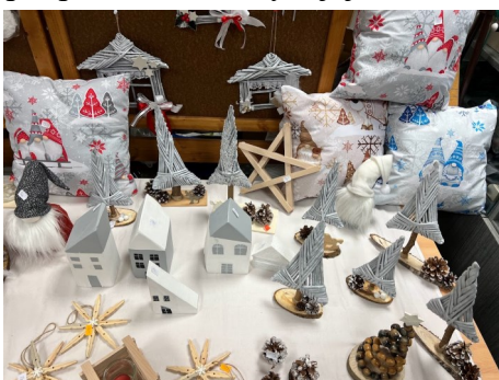
Denní stacionář Domino

V našich zařízeních se klienti v rámci volnočasových aktivit s oblibou věnují výrobě různých deko-račních předmětů. Ty jsou potom nabízeny v rámci výstav v samotných zařízeních, či na akcích, jichž se pravidelně účastníme. Návštěvníci si mohou dané výrobky pořídit v rámci veřejné sbírky a podpořit tím klienty v jejich další činnosti. Děkujeme všem, kteří pomáháte.