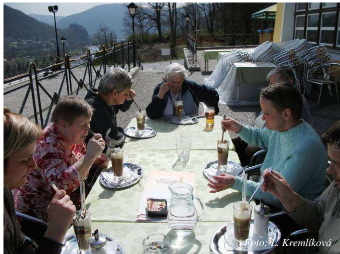
Odpočinek při kávě