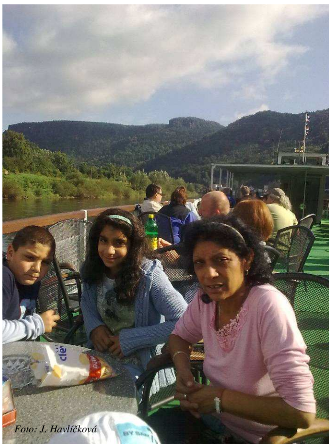
Plavba byla skutečně velmi příjemná

volavku. Nádherné okolí pískovcových skal uchvacovalo svou monumentálností a mezi skalami se objevila na chvíli i vyhlídka Belveder na Labské stráni, která se nám stala námětem na příští výlet. Nemístní, byli upozorněni na cyklostezku kopírující povodí Labe z Děčína až do Německa. V Hřensku jsme došli ke vstupu do Soutěsek a viděli, jak se město postupně vzpamatovává z minulých povodní. Nechyběla ani malá svačinka. Děti samozřejmě u každého krámku obdivovaly "bakugany, gormity" a další podivná stvoření, která jsou pro mnohé z nás velkou neznámou. Pak už jen zbývalo nasednout do autobusu a zakončit výlet vzájemným rozloučením, s tím, že už teď se všichni moc těšíme na příští akci. -jh-