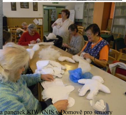
Výroba panenek KIWANIS v Domově pro seniory