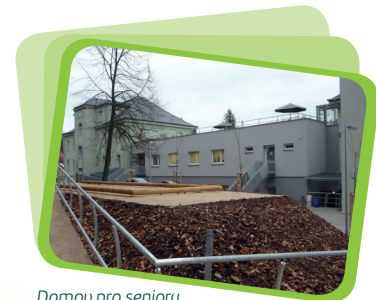
Domov pro seniory po rekonstrukci