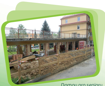
Domov pro seniory rekonstrukce