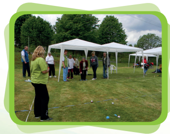
na turnaji v pétanque DOZP Brtniky