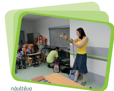
návštěva ze ZOO Děčín