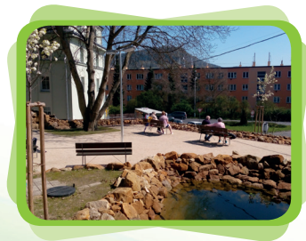
Domov pro seniory zahrada po rekonstrukci