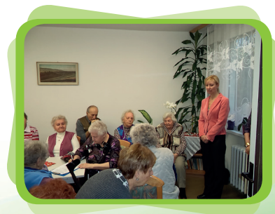
setkání s primátorkou