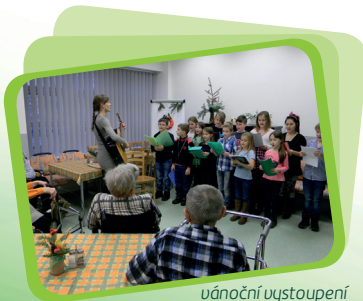
úánoční vystoupení ZŠ Dr. M. Tyrše

Mimo zavedené aktivity se klienti mohli i nadále věnovat dalším volnočasovým aktivitám, které měly kulturní, společenský a sportovní charakter.