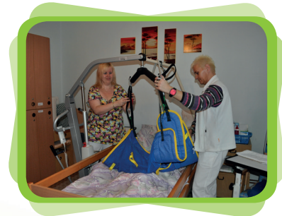
použití zvedáku pro imobilní klienty