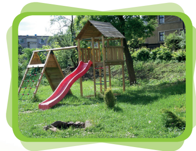
zahrada Azylového domu

Díky programu „Volný čas 2015“ jsme mohli realizovat keramický kroužek, který byl určen k rozvoji výtvarných dovedností nejen dětí, ale i jejich maminek. S pomocí projektu jsme mohli nakoupit veškerý materiál na práci s keramikou (hlínu, glazury, formy a náčiní na zpracování keramiky).